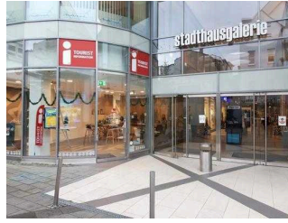
Eingang zur Tourist-Information