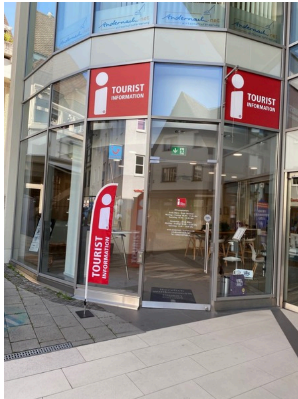
Tourist Information Andernach