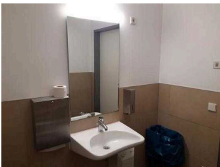
WC für Menschen mit Behinderungen in der Stadtgalerie