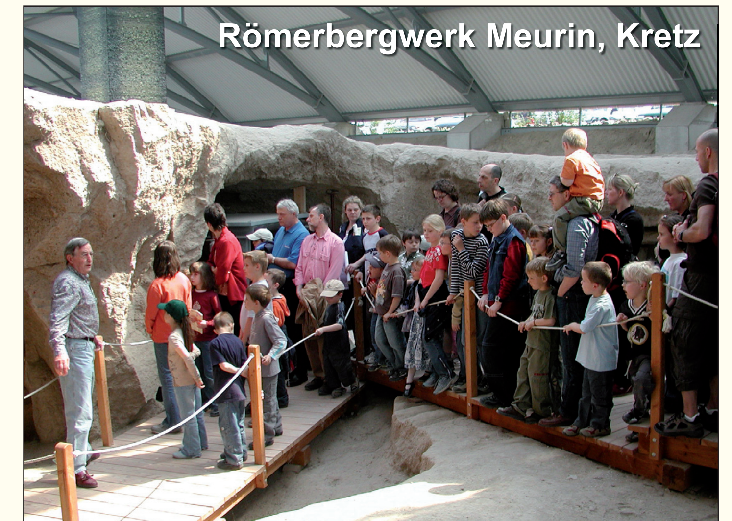
Römerbergwerk Meurin, Kretz

Von Mayen bis nach Andernach bietet der Vulkanpark-Radweg einen vielfältigen Querschnitt durch die vulkanische Osteifel. Die Route erschließt einige der Vulkanparkstationen, so dass die Radtour mit dem Besuch von Informationszentren bzw. Museen und Außendenkmälern kombiniert werden kann.